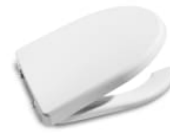
Abattant double thermodur antibactérien avec lunette anti-contact pour WC